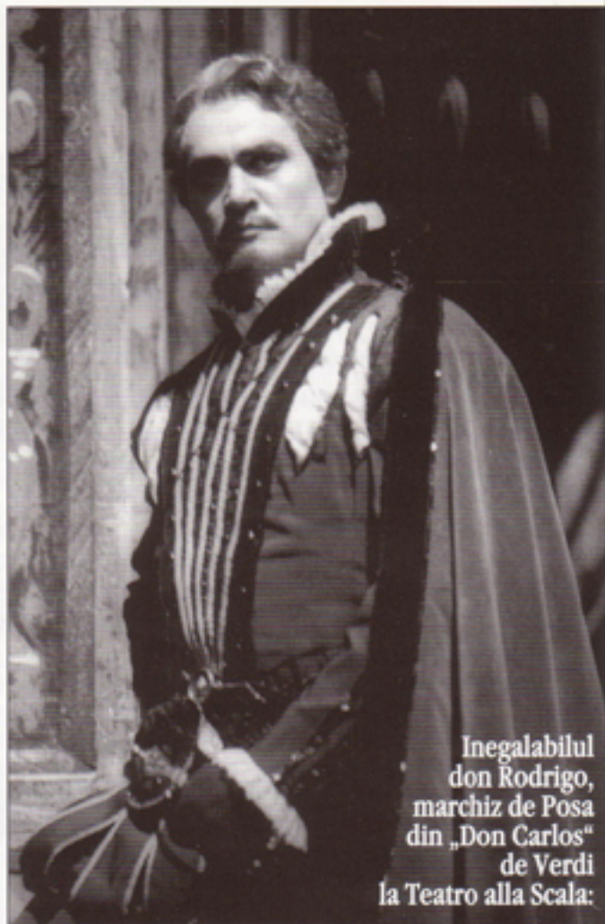
Inegalabilul don Rodrigo, marchiz de Posa din „Don Carlos” de Verdi la Teatro alla Scala:

riu al unei mari cariere artistice, iar pentru România au însemnat o recunoaștere a valorilor sale culturale.